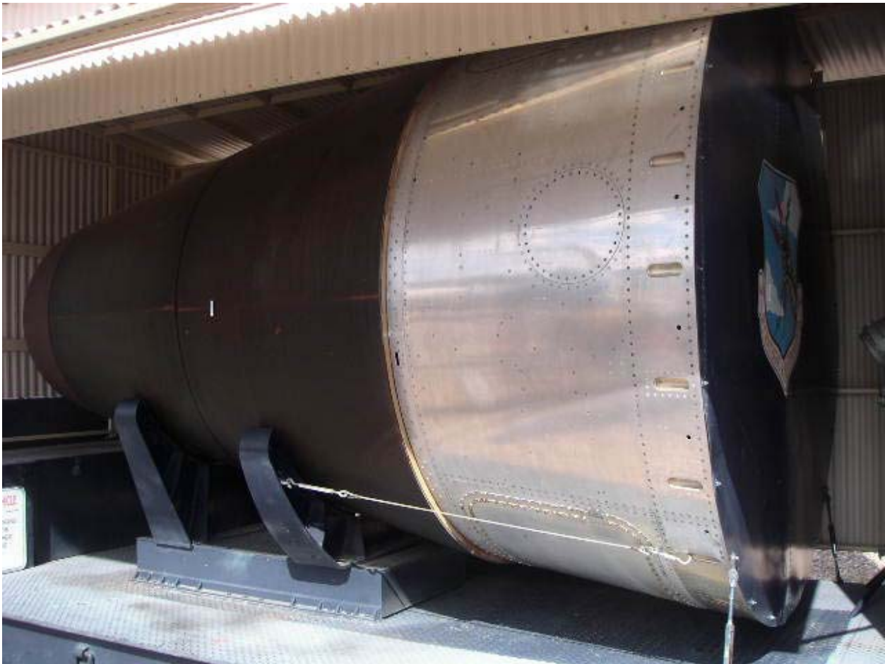
6.900 järnvägsvagnar fullastade med dynamit - i en kvarts järnvägsvagn - den så naivt kallade "stridsspetsen" Prata om begreppsförvirring!

garageporten med en fjärröppnare och storma in i stugan med orden: "Älskling! Vad blir det till middag i dag?"