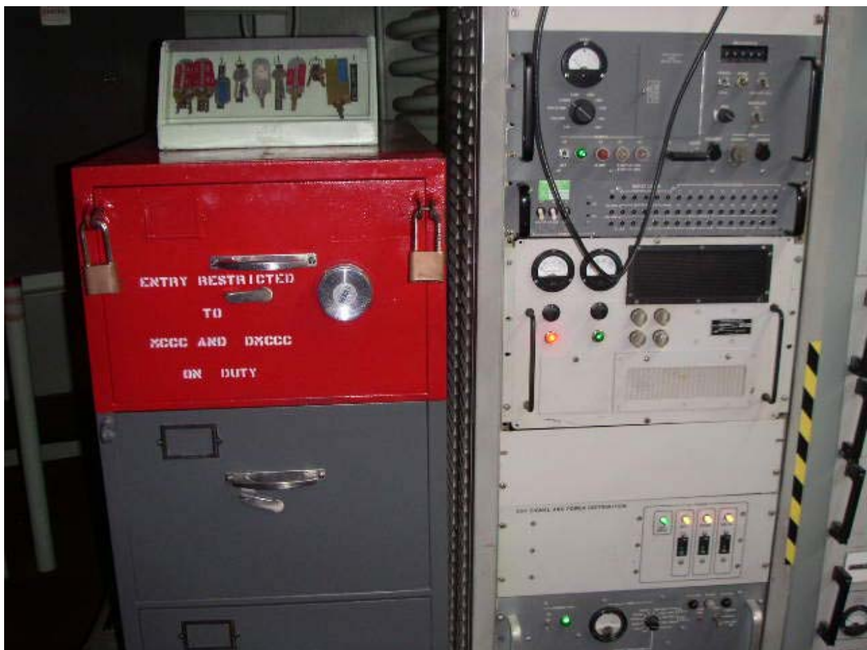
"Röda skåpet till vänster med den 16-siffriga koden som skall överensstämma med presidentens"