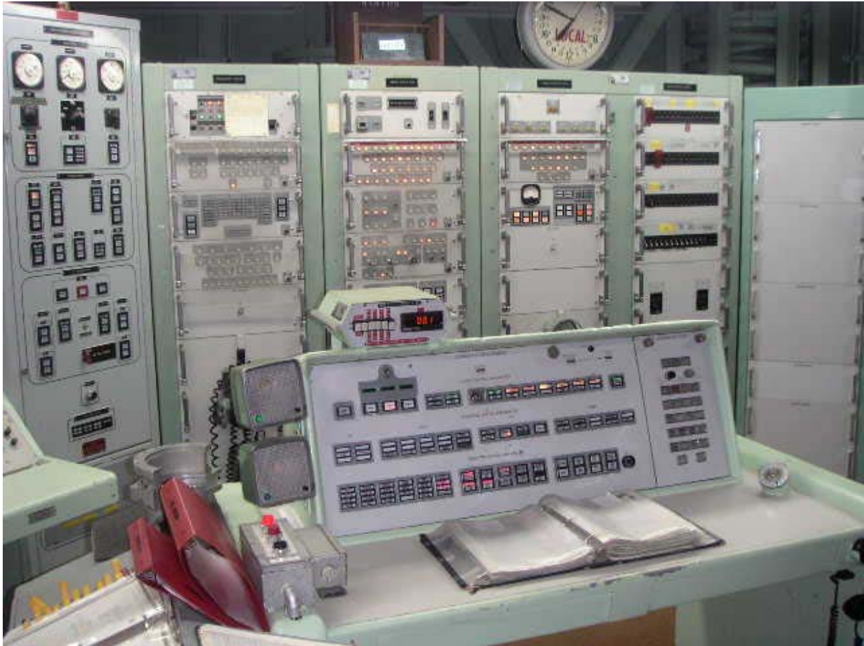
Kontrollpanelen med det 16-siffriga kodlåset mitt i bild, strax under den bruna trälådan invid 24-timmars-klockan

Ovanför det röda skåpet på bilden innan den ovan finns två avskjutningsnycklar. Både chefen för rampen och en assistent måste sätta in varsin av dem som sedan måste vridas om samtidigt (inom 2 sekunder) och hållas intryckta i 5 sekunder innan nedräkningen mot den förutbestämda avfyringstidpunkten börjar. När detta var gjort - kunde inget stoppa raketerna. De kunde inte styras om, skjutas ner eller förstöras. Domedagen var kommen.