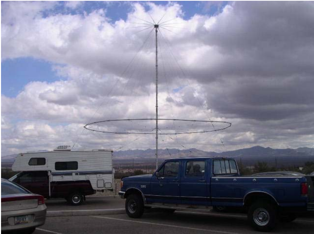
En "oskyldig" antenn som skulle kunna tillhöra vilken "långvågssentusiast" som helst. Denna är dock ägnad att ta emot bara ett kort meddelande - en enda gång!

Men det var inte vilken antenn som helst. Det var genom den som presidentens dödsorder skulle komma: Ordern att sända iväg en vätebomb som skulle radera ut ungefär 50 miljoner människors liv och verk.